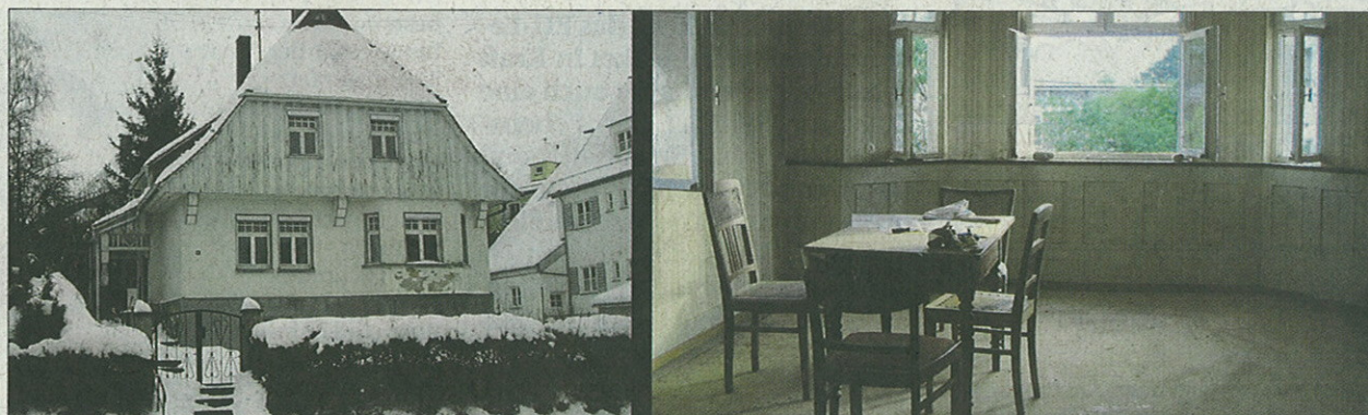
Das Gebäude Mittelhofstraße 6 von außen (links) und ein Blick in das helle Wohnzimmer.